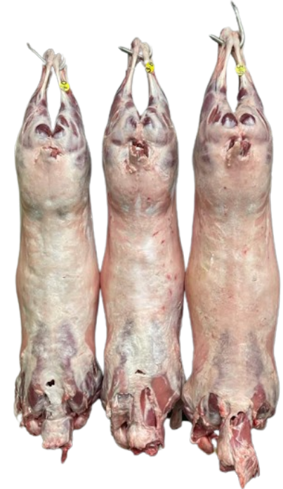
Suffolk x Texel